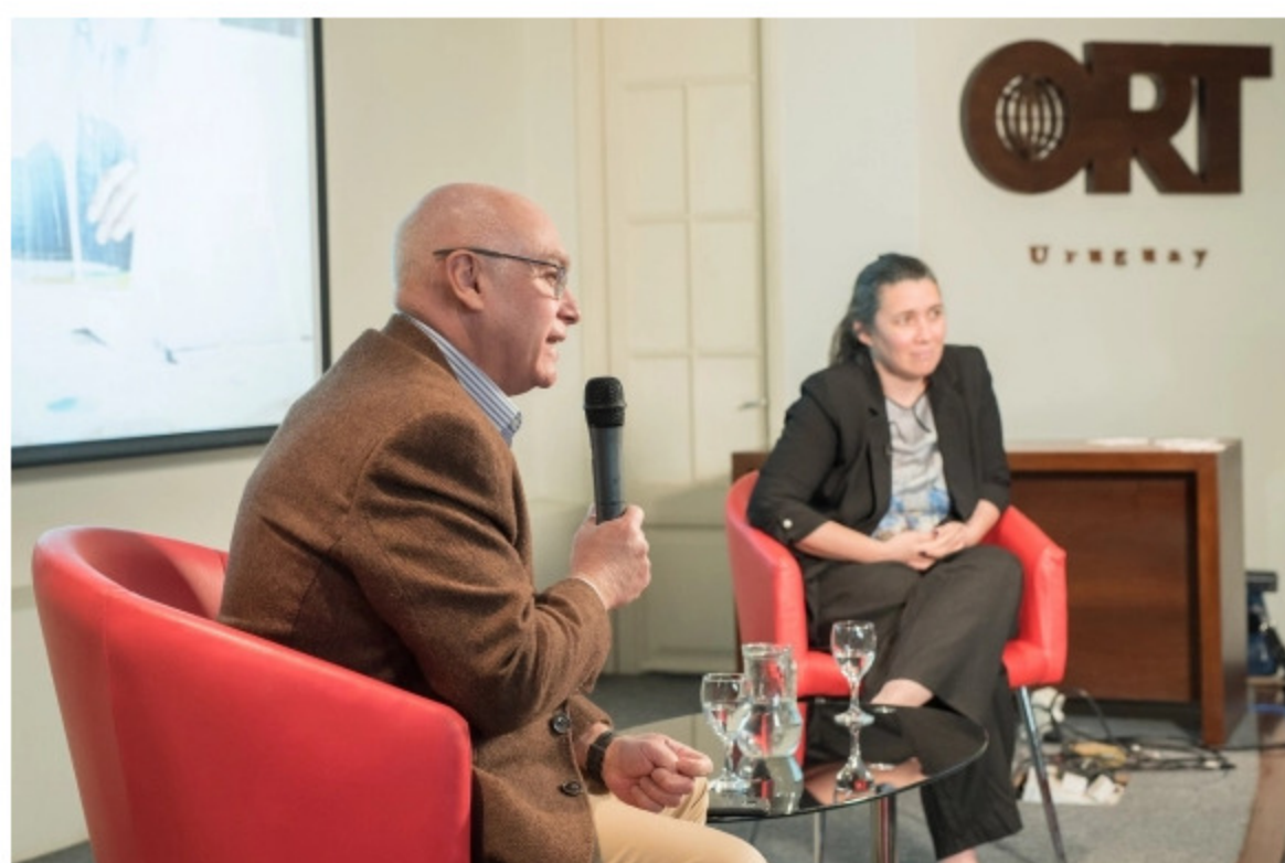
Presentación de la nueva orientación en la ORT.