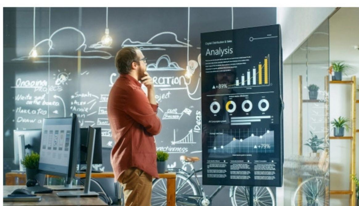
Universidad ORT Uruguay lanza nueva orientación en Lic. en Comunicación.

La orientación no tiene un enfoque tecnocéntrico, sino que busca, a partir de una multialfabetización, entender la comunicación, los fenómenos de la digitalización, el comportamiento de las audiencias y la detección de oportunidades.