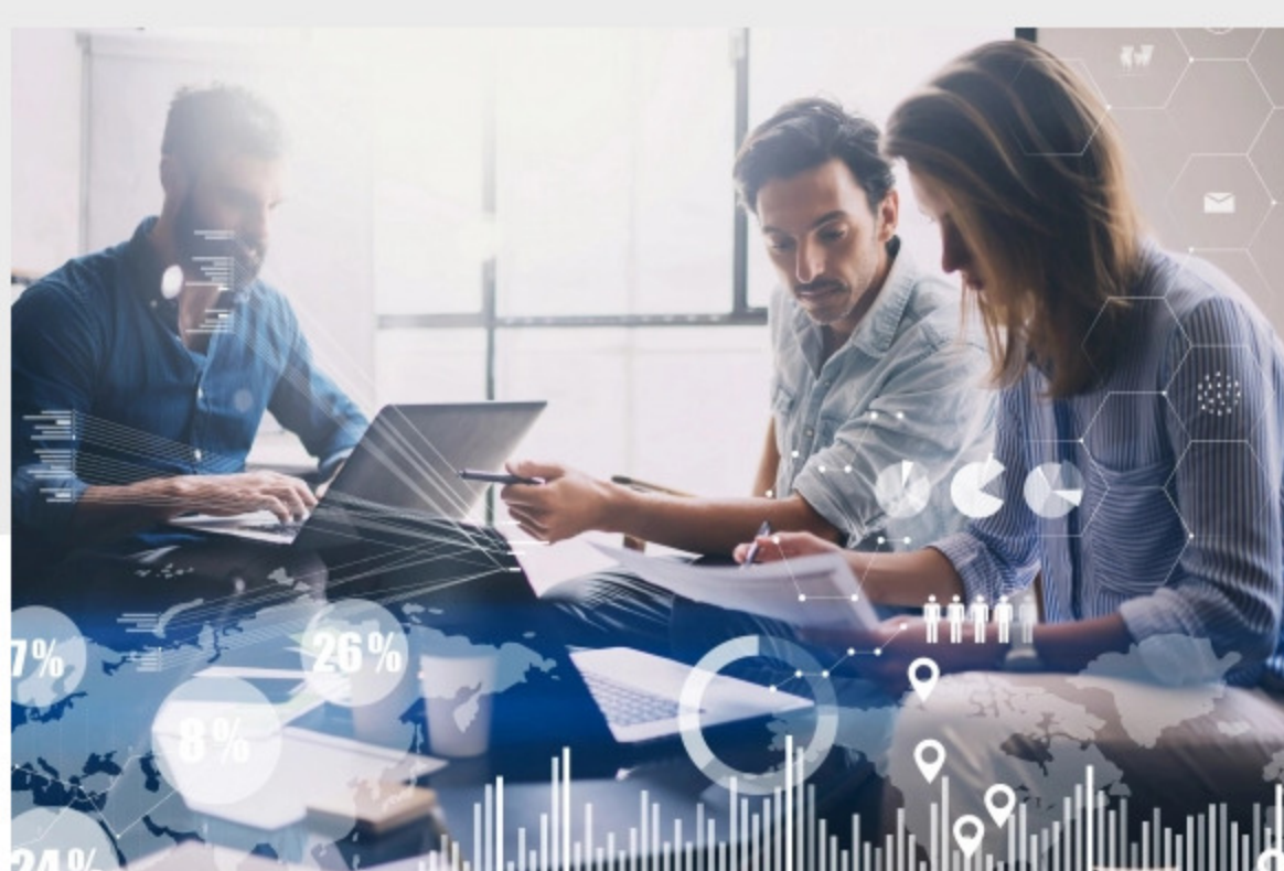
Universidad ORT Uruguay lanza nueva orientación en Lic. en Comunicación.

Comunicadores que entiendan de números y sepan expresarlo en un lenguaje que todos comprendan: esto es lo que propone Análítica de Datos e Innovación , la nueva orientación de la Licenciatura en Comunicación de Universidad ORT Uruguay , que iniciará en marzo de 2021.