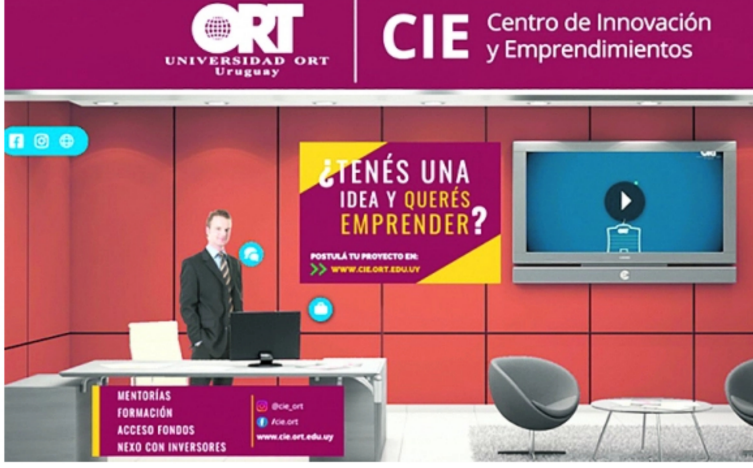
Universidad ORT Uruguay