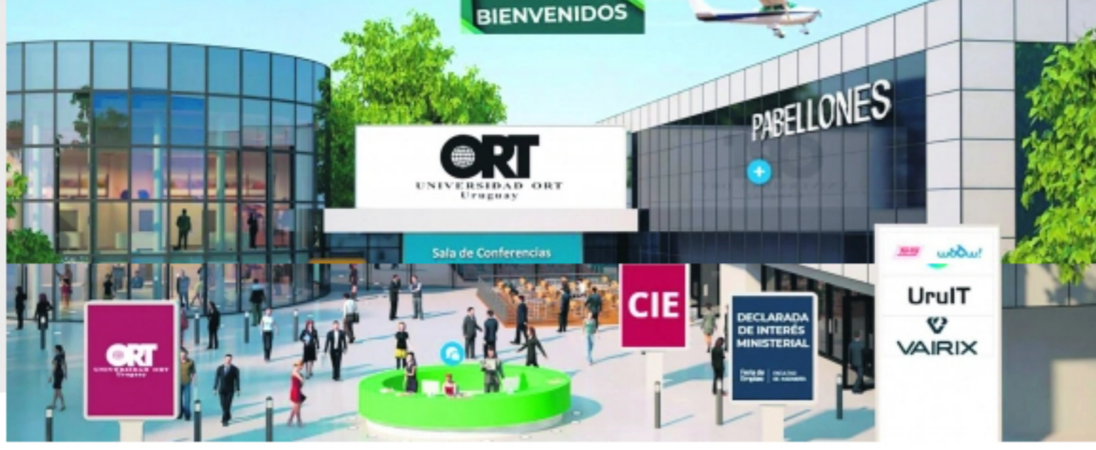
Universidad ORT Uruguay

Con un cambio de escenario y ante el desafío de mantener el mismo interés entre los estudiantes y graduados, el 20 de octubre se realizó la Feria de Empleo, evento de referencia en el sector de tecnología.