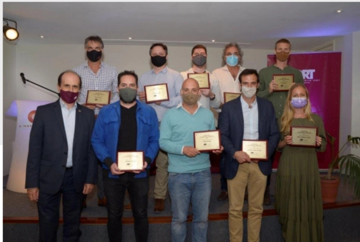
Segunda edición de los Reconocimientos a la Creatividad y la Innovación, de la Facultad de Comunicación y Diseño de la Universidad ORT Uruguay.