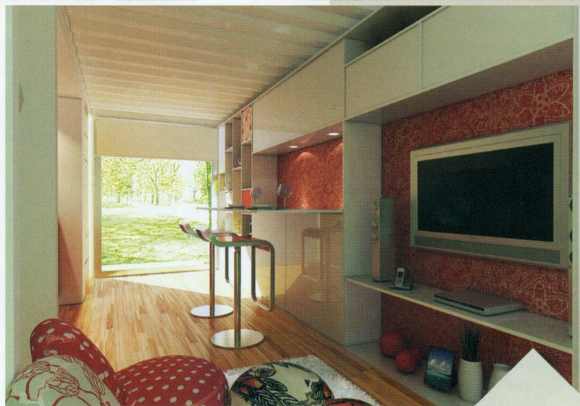
PROYECTO: FLORENCIA DE CAPRIO

tura en Diseño de Interiores, la facultad revisa el contenido de sus planes de estudio ajustándolos de acuerdo a la opinión de nuestros graduados, de los empleadores y de nuestra comunidad académica. Nuestra Oficina de Coordinación de Graduados mantiene un diálogo constante con todos nuestros egresados a fin de evaluar las debilidades y fortalezas de la formación recibida a la hora del ejercicio profesional. Esta misma información nos es provista por los empleadores que los reciben. A estos procesos se suma la constante autoevaluación que desarrollamos con nuestra comunidad académica, recabando la opinión de docentes y estudiantes.