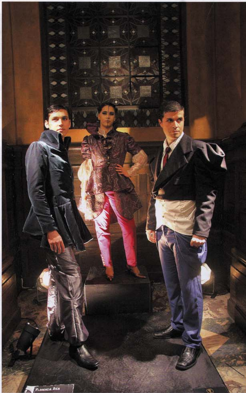
Colección "Times Goes By ..." de Florencia Sica.