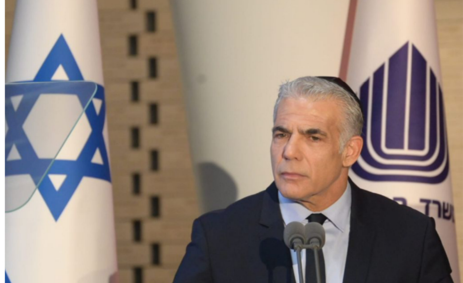
El Primer Ministro de Israel Yair Lapid

Asimismo, Lapid, y esto hay que tenerlo en cuenta, ha mostrado una línea más agresiva hacia Rusia y más clara en su apoyo a Ucrania. En ese sentido es que estamos viendo también estas críticas rusas de este último tiempo hacia Israel.