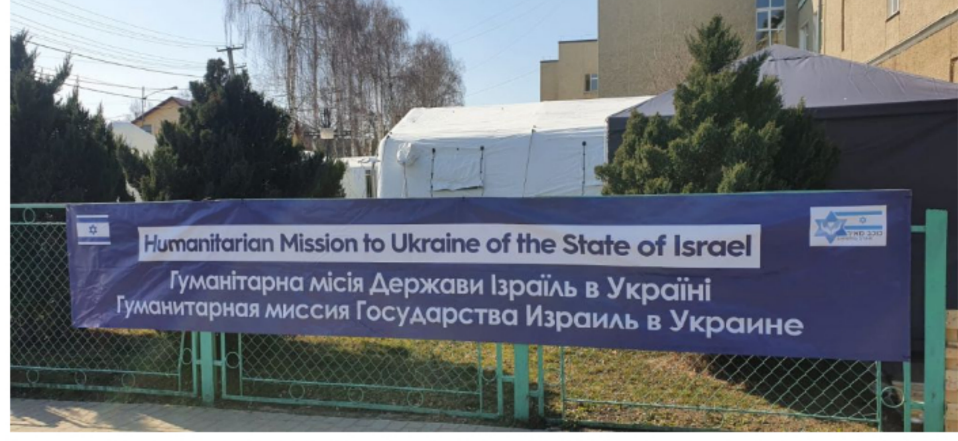
Israel prestó importante ayuda humanitaria a Ucrania. Se destacó el hospital de campaña manejado por el Centro Médico Sheba y el Ministerio de Salud de Israel