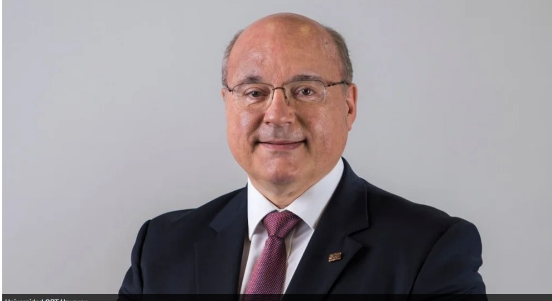
Universidad ORT Uruguay.