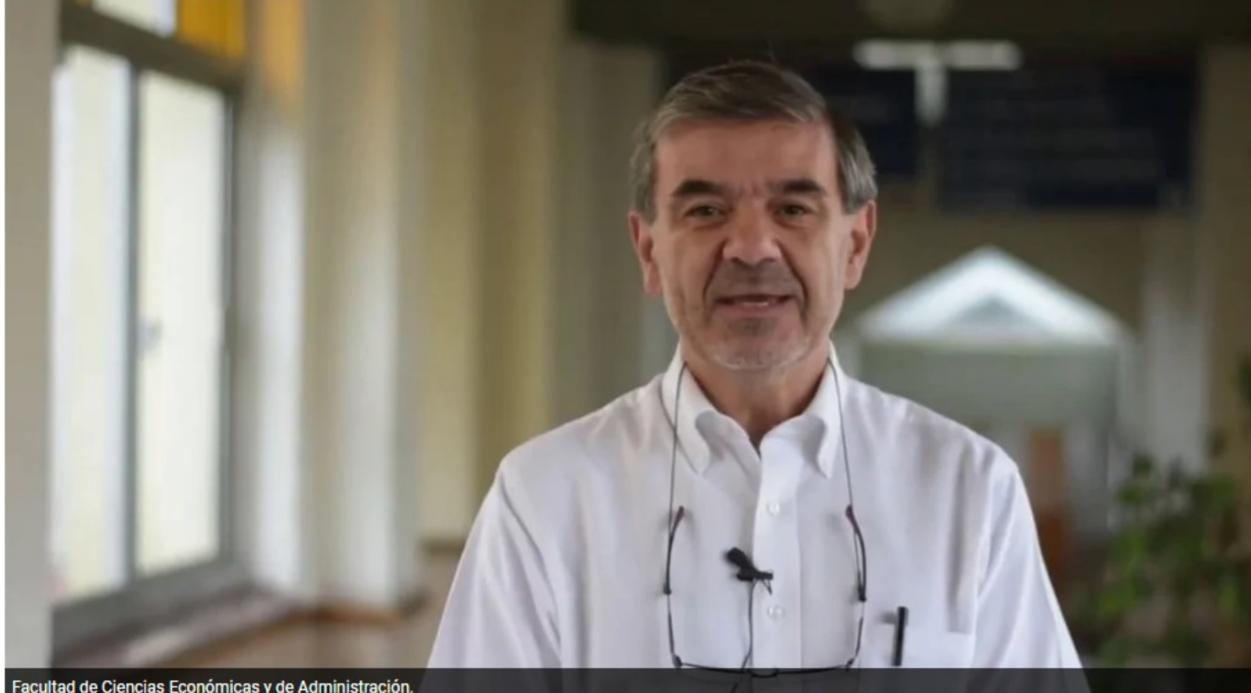
Facultad de Ciencias Económicas y de Administración.