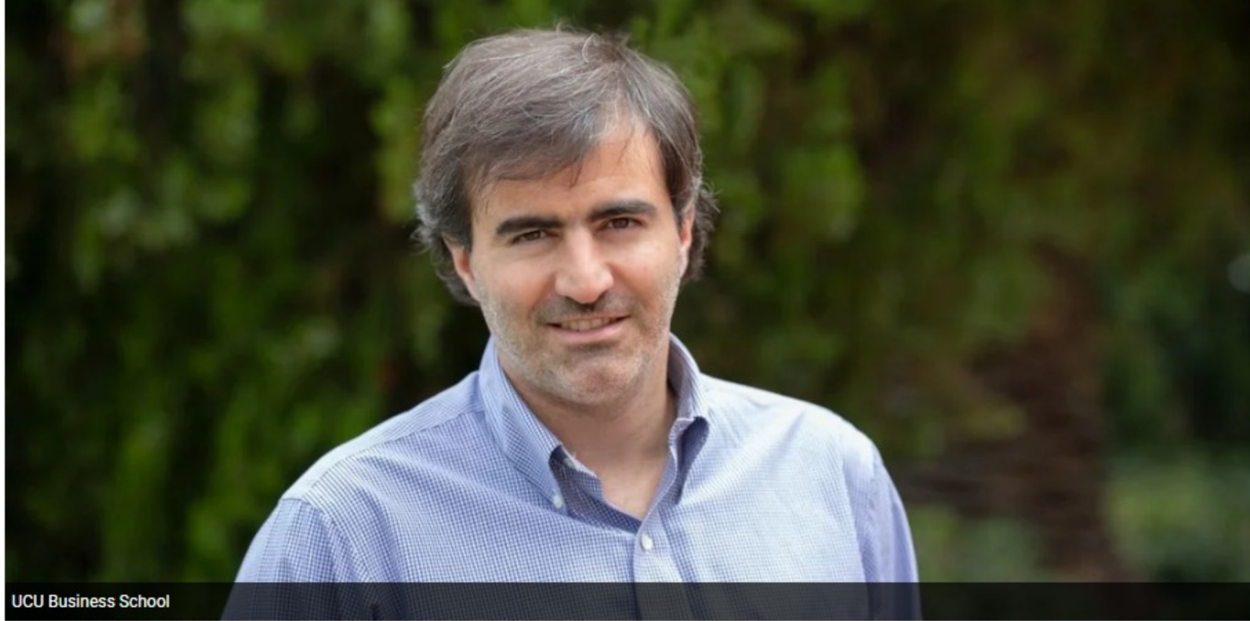
UCU Business School