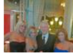
FOTO Las actrices pornos que han sido relacionadas a presidentes 6.328 visitas

NOTICIAS Siete reglas para evitar que su celular domine su vida 1.272 visitas