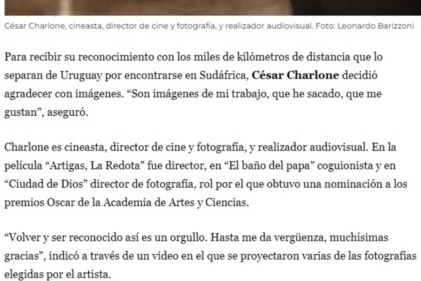
César Charlone, cineasta, director de cine y fotografía, y realizador audiovisual.

Para recibir su reconocimiento con los miles de kilómetros de distancia que lo separan de Uruguay por encontrarse en Sudáfrica, César Charlone decidió agradecer con imágenes. “Son imágenes de mi trabajo, que he sacado, que me gustan”, aseguró.