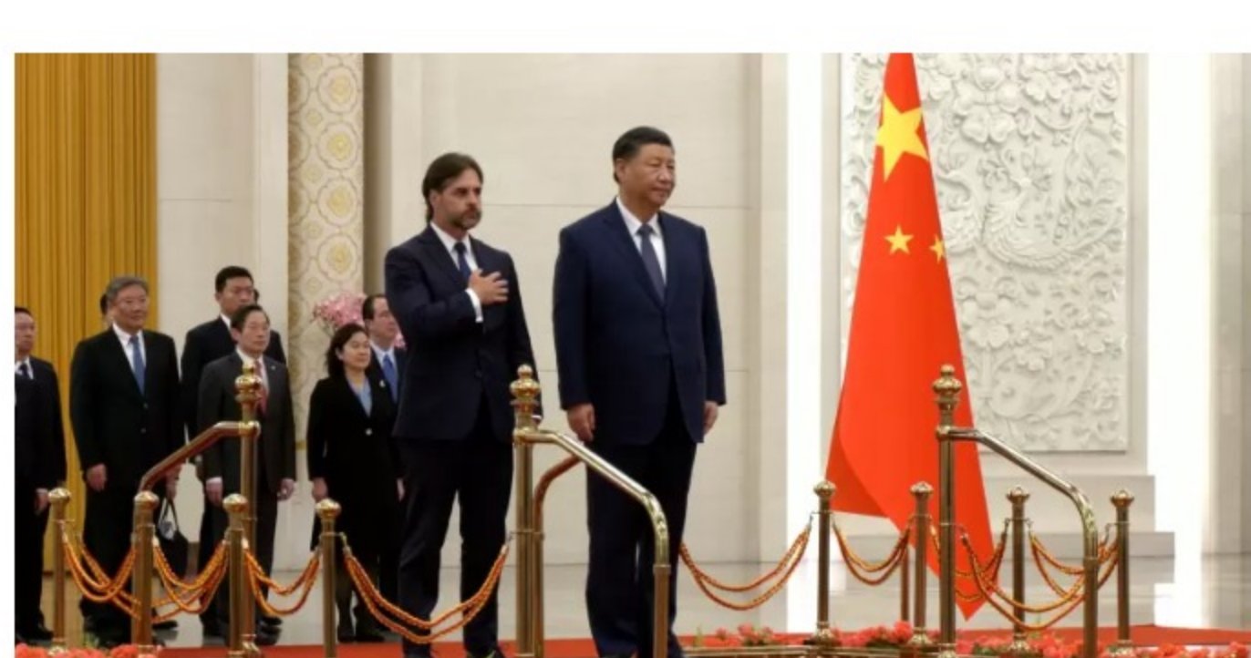
Luis Lacalle Pou, presidente de Uruguay, junto a Xi Jinping, presidente de China.