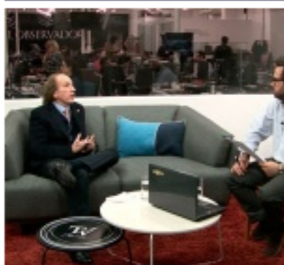
Rector de la ORT: un joven pobre tiene más chances de jugar en la celeste, que terminar un máster