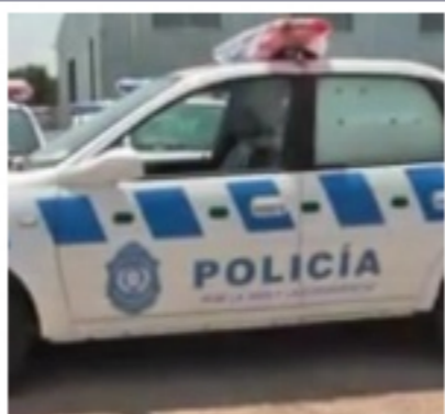
Justicia indaga a diez funcionarios policiales por irregularidades con servicio 222