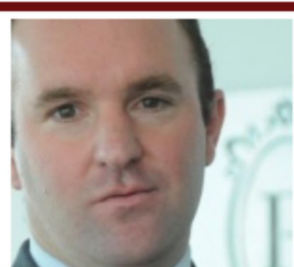
*Falta muchísima educación financiera en Uruguay*