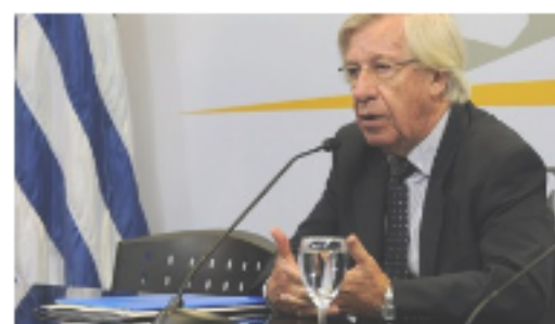
Habrà inversión pública y facilidades para las privadas En "Edición Impresa"