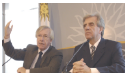
Anuncio de Vázquez es respaldo a un proceso económico exitoso En "Edición Impresa"