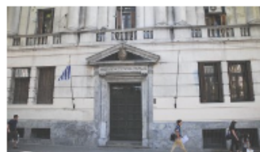
Economía emitió bonos 2050 y recompra de títulos de 2015 a 2045 En "Economía"