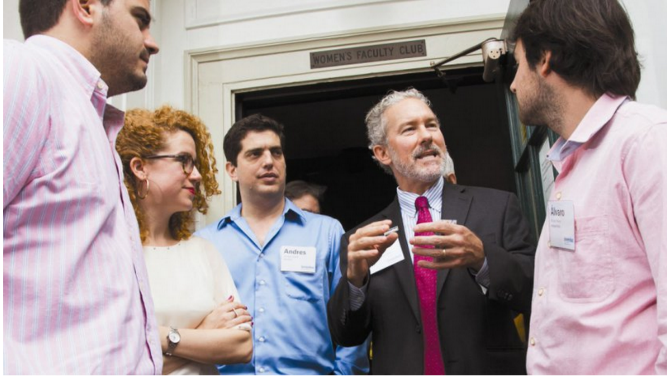
Emprendedores uruguayos junto al decano de la Escuela de Negocios Haas de UC Berkeley