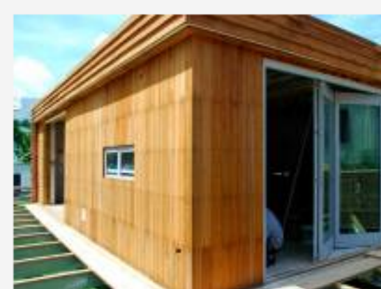
"La Casa Uruguaya", energéticamente eficiente

"La Casa Uruguaya" (LCU) fue concebida por profesores y alumnos de la Universidad ORT, que presentaron un proyecto para el "Solar Decathlon Latinoamérica y Caribe 2015", una competencia internacional de construcción de prototipos de viviendas que sean sostenibles y eficientes desde el punto de vista energético.