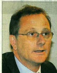
Gili: "Uruguay enfrenta riesgos y necesita cabeza más innovadora".