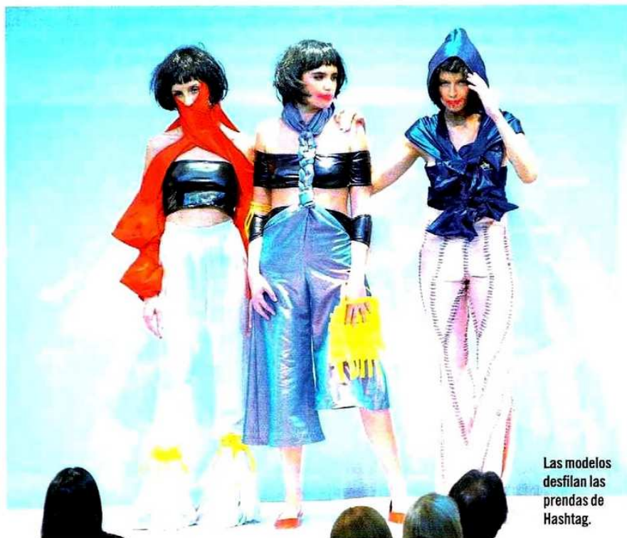
Las modelos desfilan las prendas de Hashtag.