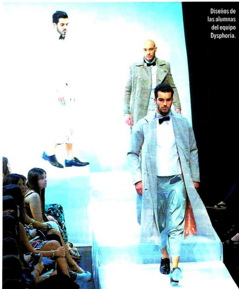
Diseños de las alumnas del equipo Dysphoria.