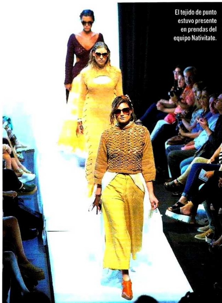
El tejido de punto estuvo presente en prendas del equipo Nativitate.