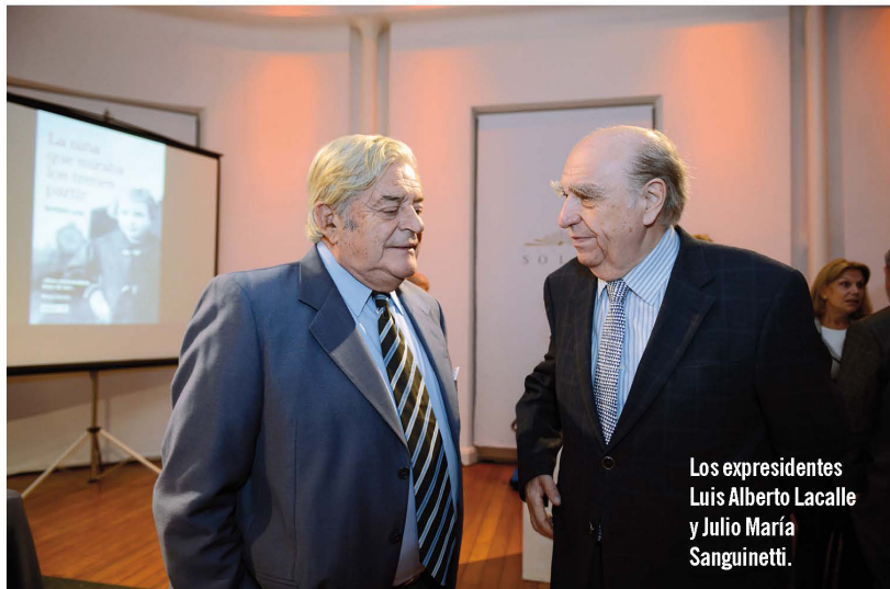
Los expresidentes Luis Alberto Lacalle y Julio María Sanguinetti.