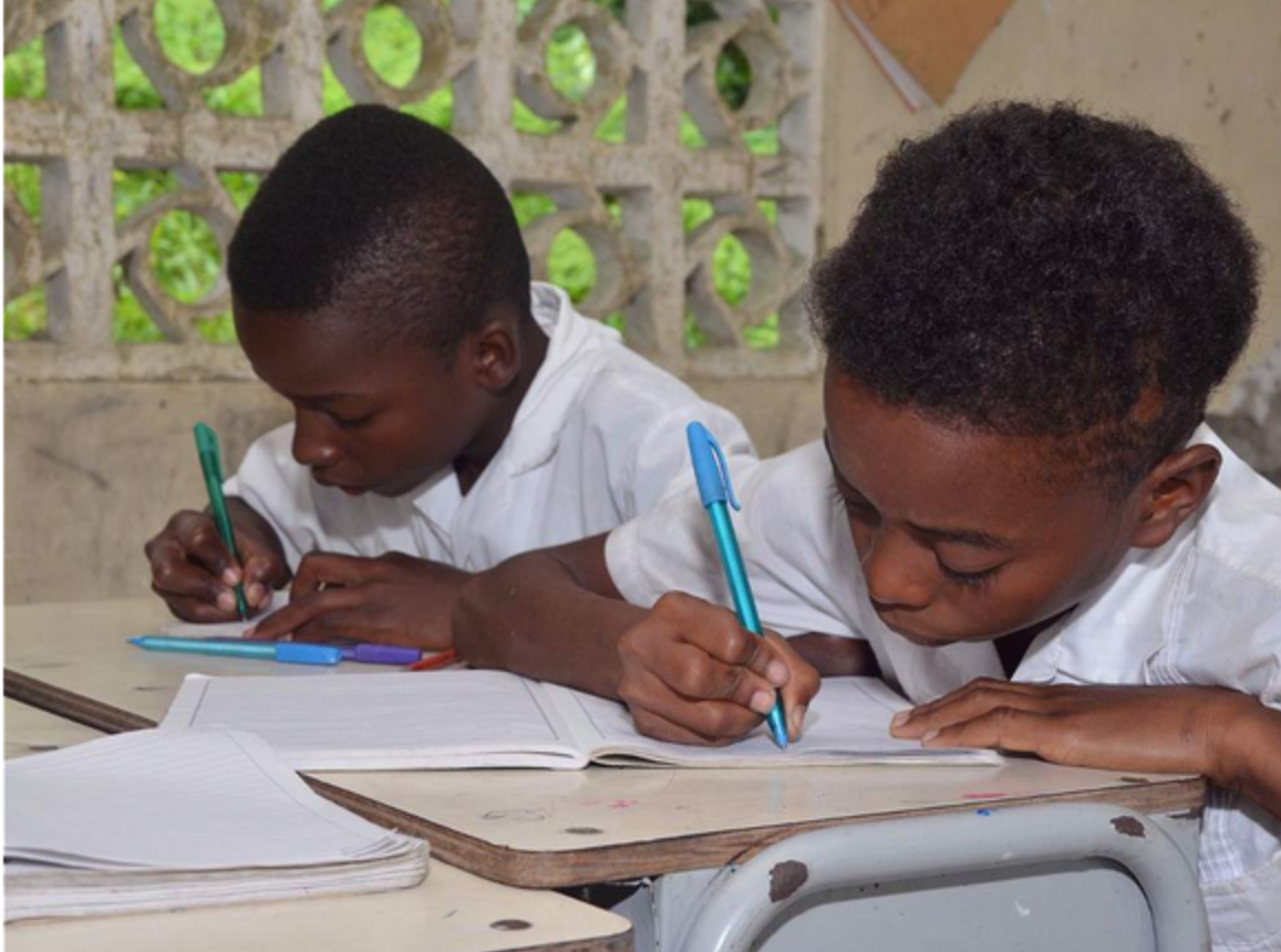
Escuela Nueva es la mejor propuesta de superación del modelo tradicional de enseñanza.

En cuatro modelos educativos que existen en América Latina y el Caribe, Aguerrondo y Vaillant identificaron elementos que rompen con el modelo tradicional de enseñanza y, por tanto, son referentes para la región. Uno de ellos es Escuela Nueva, de Colombia.