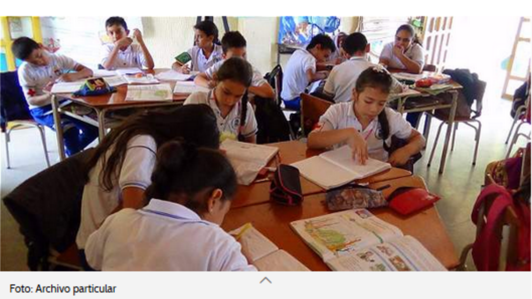
Escuela Nueva en el país, que ha evolucionado a Escuela Nueva Activa, ha sido replicado e...

Por: Ángela Constanza Jerez | 11:27 a.m. 11 de noviembre de 2016