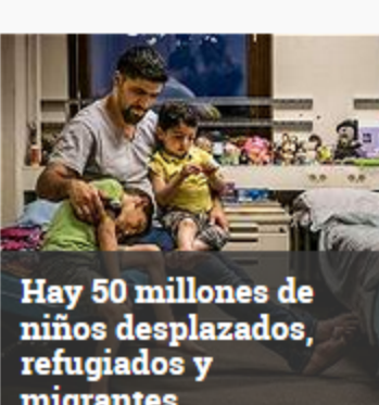
Hay 50 millones de niños desplazados, refugiados y migrantes