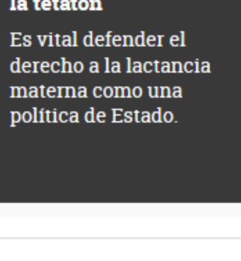
Editorial: Bienvenidos la tetrón Es vital defender el derecho a la lactancia materna como una política de Estado.