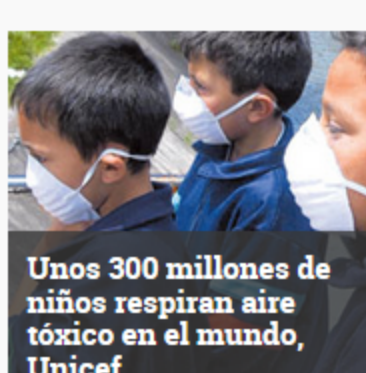
Unos 300 millones de niños respiran aire tóxico en el mundo, Unicef