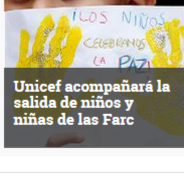
Unicef acompaña la salida de niños y niñas de las Farc