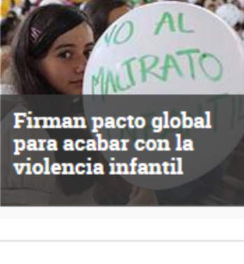
Firman pacto global para acabar con la violencia infantil