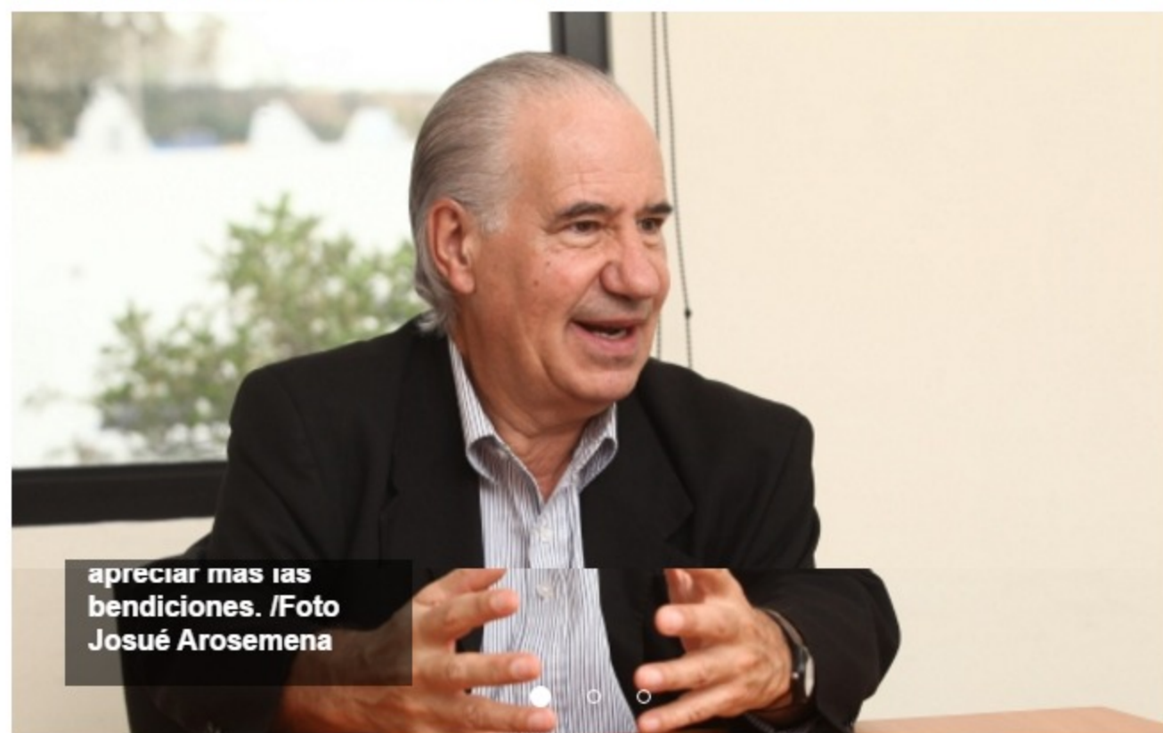
apreciar mas las bendiciones.

'El hombre sigue tropezándose con las mismas piedras', afirmó el escritor Ruperto Long.