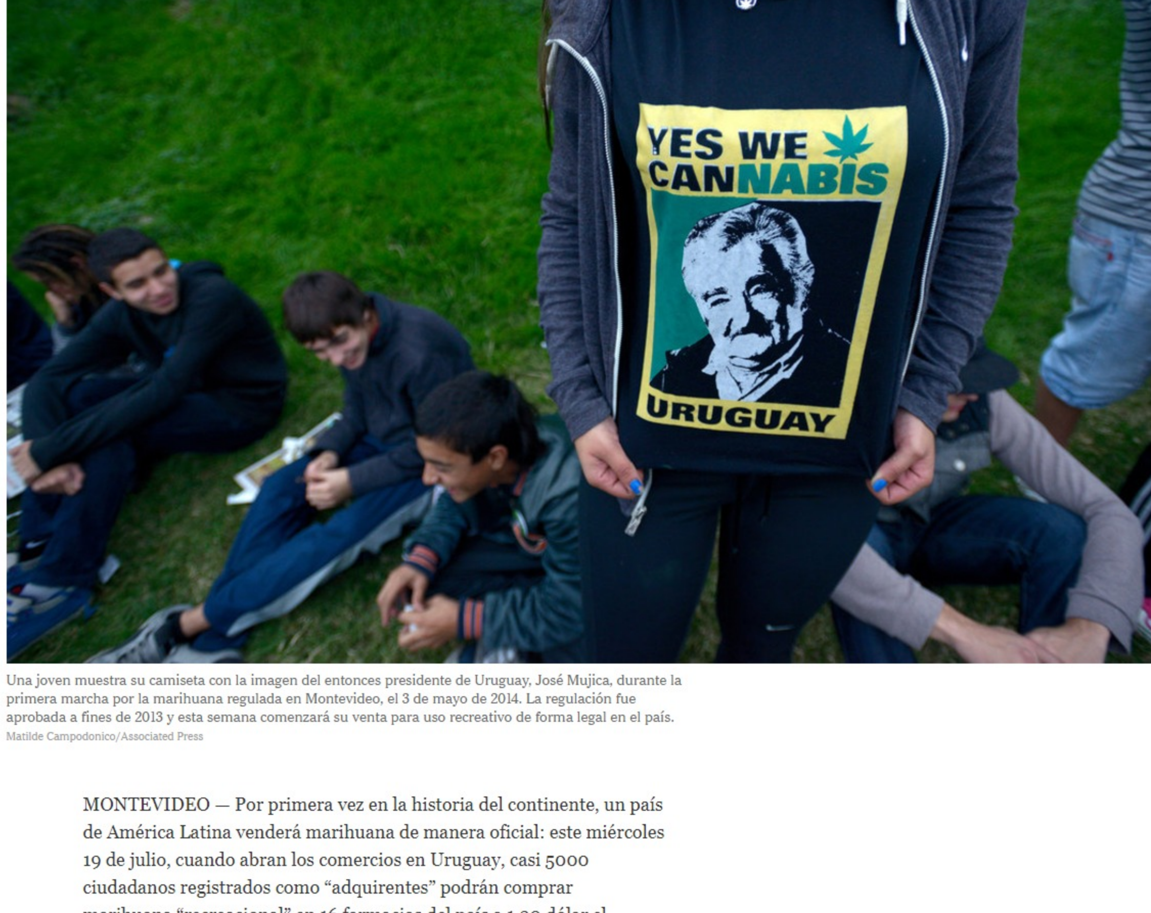
Una joven muestra su camiseta con la imagen del entonces presidente de Uruguay, José Mujica, durante la primera marcha por la marihuana regulada en Montevideo, el 3 de mayo de 2014. La regulación fue aprobada a fines de 2013 y esta semana comenzará su venta para uso recreativo de forma legal en el país.

MONTEVIDEO — Por primera vez en la historia del continente, un país de América Latina venderá marihuana de manera oficial: este miércoles 19 de julio, cuando abran los comercios en Uruguay, casi 5000 ciudadanos registrados como "adquirentes" podrán comprar marihuana "recreacional" en 16 farmacias del país a 1,30 dólar el gramo.