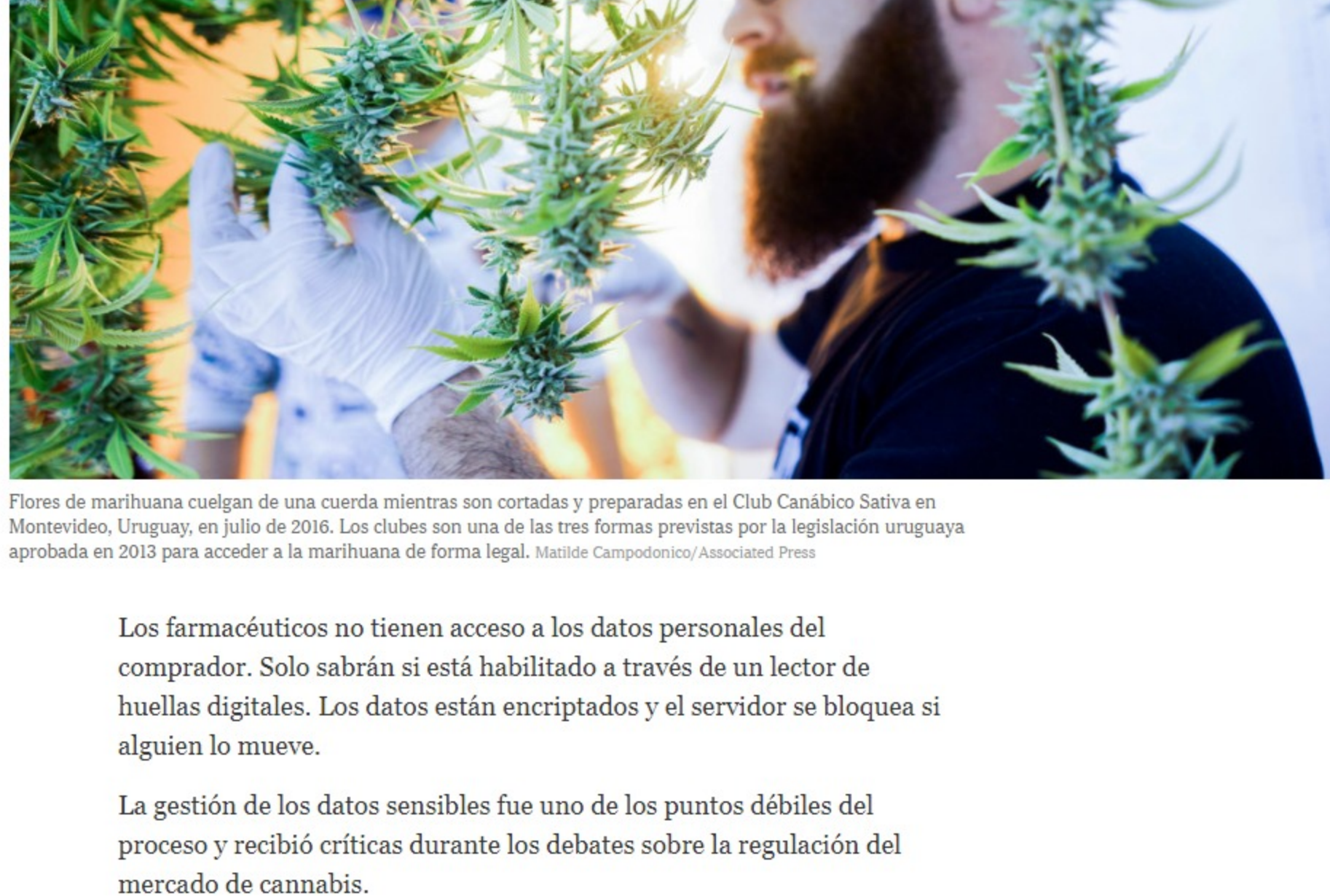
Flores de marihuana cuelgan de una cuerda mientras son cortadas y preparadas en el Club Cannabis Sativa en Montevideo, Uruguay, en julio de 2016. Los clubes son una de las tres formas previstas por la legislación uruguayaya aprobada en 2013 para acceder a la marihuana de forma legal.

Hasta el viernes anterior al comienzo de la venta había 4893 "adquirentes" registrados en las oficinas del correo estatal. El trámite para inscribirse no lleva más de cinco minutos y exige presentar cédula de identidad, comprobante de domicilio y responder una encuesta. Un escáner dactilar almacena las huellas de los usuarios en servidores informáticos para corroborar la identidad del comprador y que no se pasen de la cantidad permitida. El sistema usa la misma tecnología que los servicios financieros. Las otras dos formas de conseguir cannabis también requieren registro.