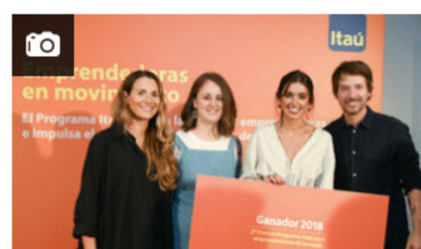
Positano y Agnes L son las marcas ganadoras del Programa Itaú