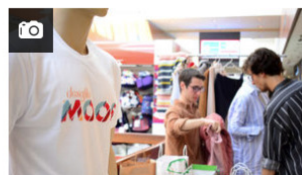
Comenzó el Desafío MOOS 2018 de Shopping Tres Cruces