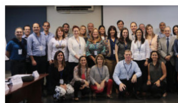
Nueve universidades del mundo se reunieron en La ORT para mejorar el vínculo empresa-academia