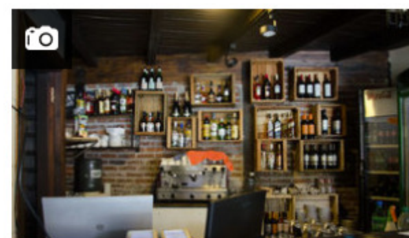
Se realizó la presentación del restaurante "Cabo Finisterre"