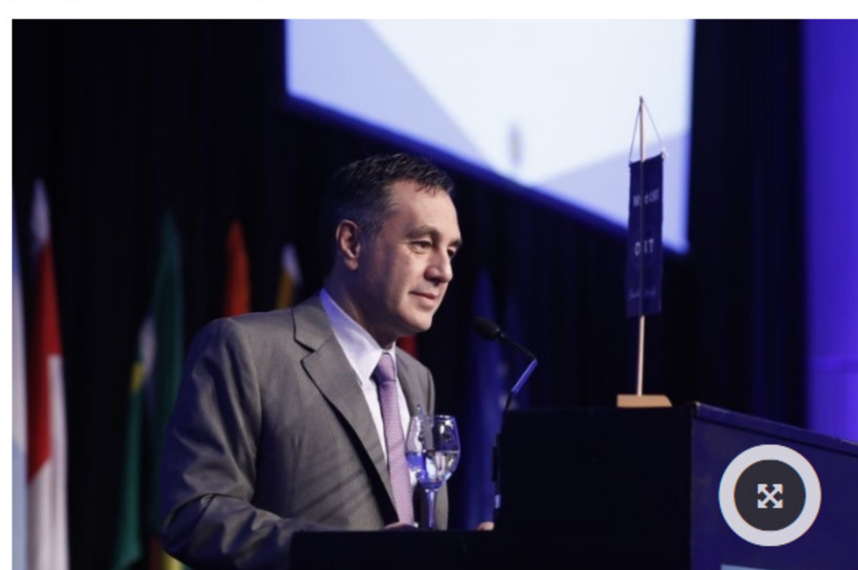
Directivos de ORT recibieron al ministro de Educación nacional