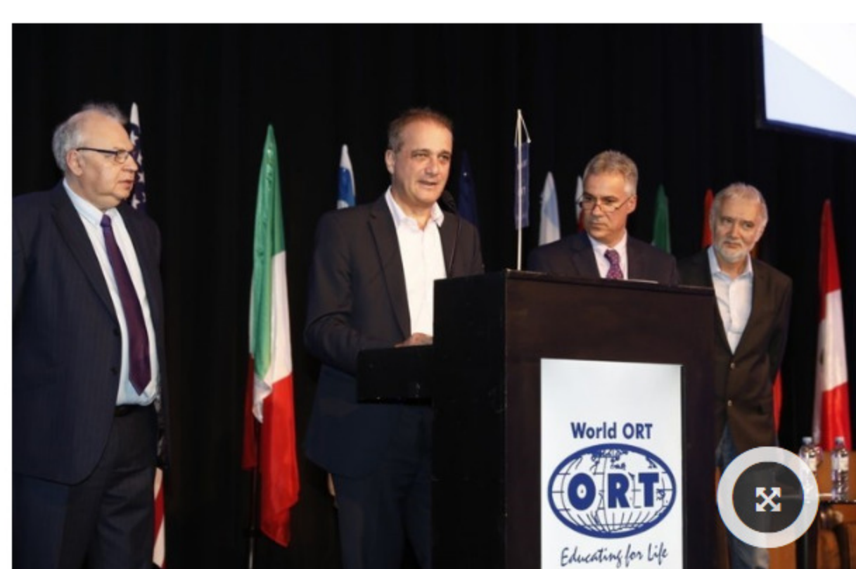
Directivos de ORT recibieron al ministro de Educación nacional

Estrenan "Embajadores de la memoria", un documental que retrata un viaje educativo estremecedor e inusual