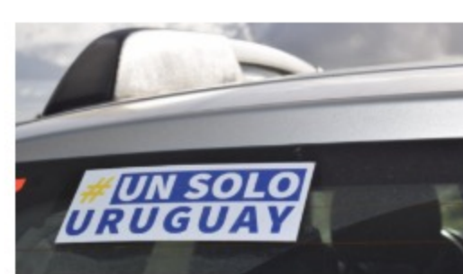
ASAMBLEA EN DURAZNO

Un Solo Uruguay juntará firmas en contra de la segunda