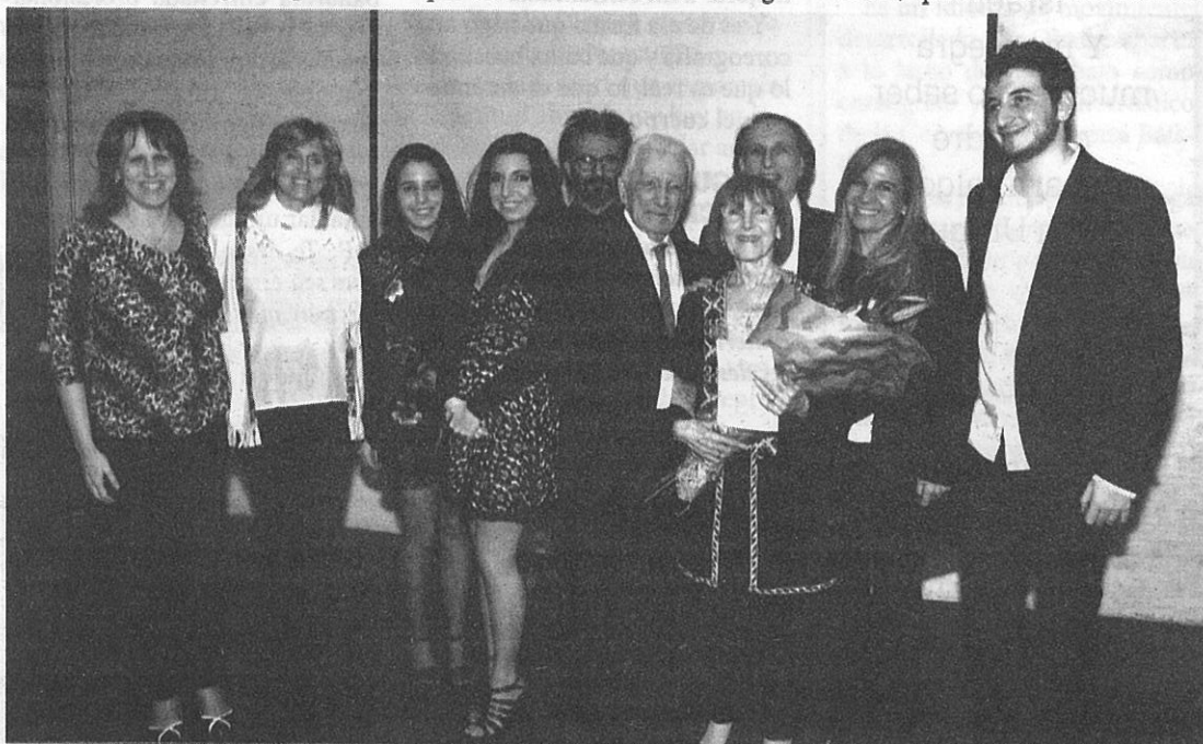
Hermoso motivos para compartir la alegría con la familia.

Visiblemente emocionada, con los asistentes de pie, rodeada de sus seres queridos y los amigos allí presentes, la homenajeadas