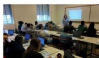
La comunidad del testing

Mobilebox arrancó entonces con tres celulares. Luego pasó a 10. Hoy ofrece 50 aparatos diferentes; entre ellos, modelos de Apple, Samsung, Sony, Motorola, Pixel, Huawei, LG, HTC y Xiaomi. "Son reales, no emuladores", afirmó el emprendedor, quien agregó que son los más utilizados en el mercado uruguayo. Primero Mobilebox solo ofrecía el sistema operativo Android pero desde hace tres meses también tiene disponible para probar apps en iOS.