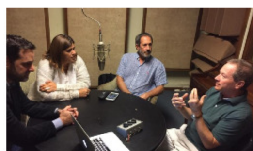
Panorama incierto y volátil en las elecciones primarias