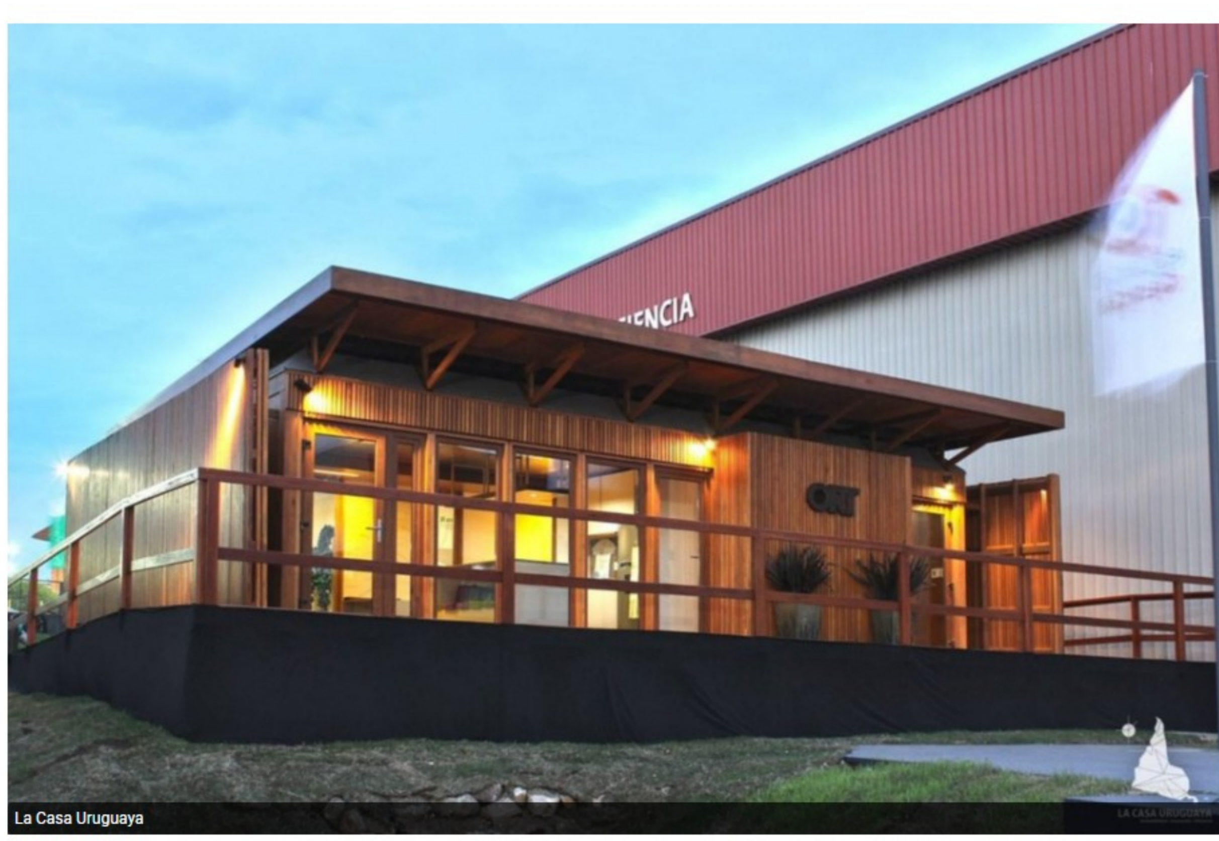
La Casa Uruguaya

Presentan esta semana emprendimientos ecológicos en una feria universitaria