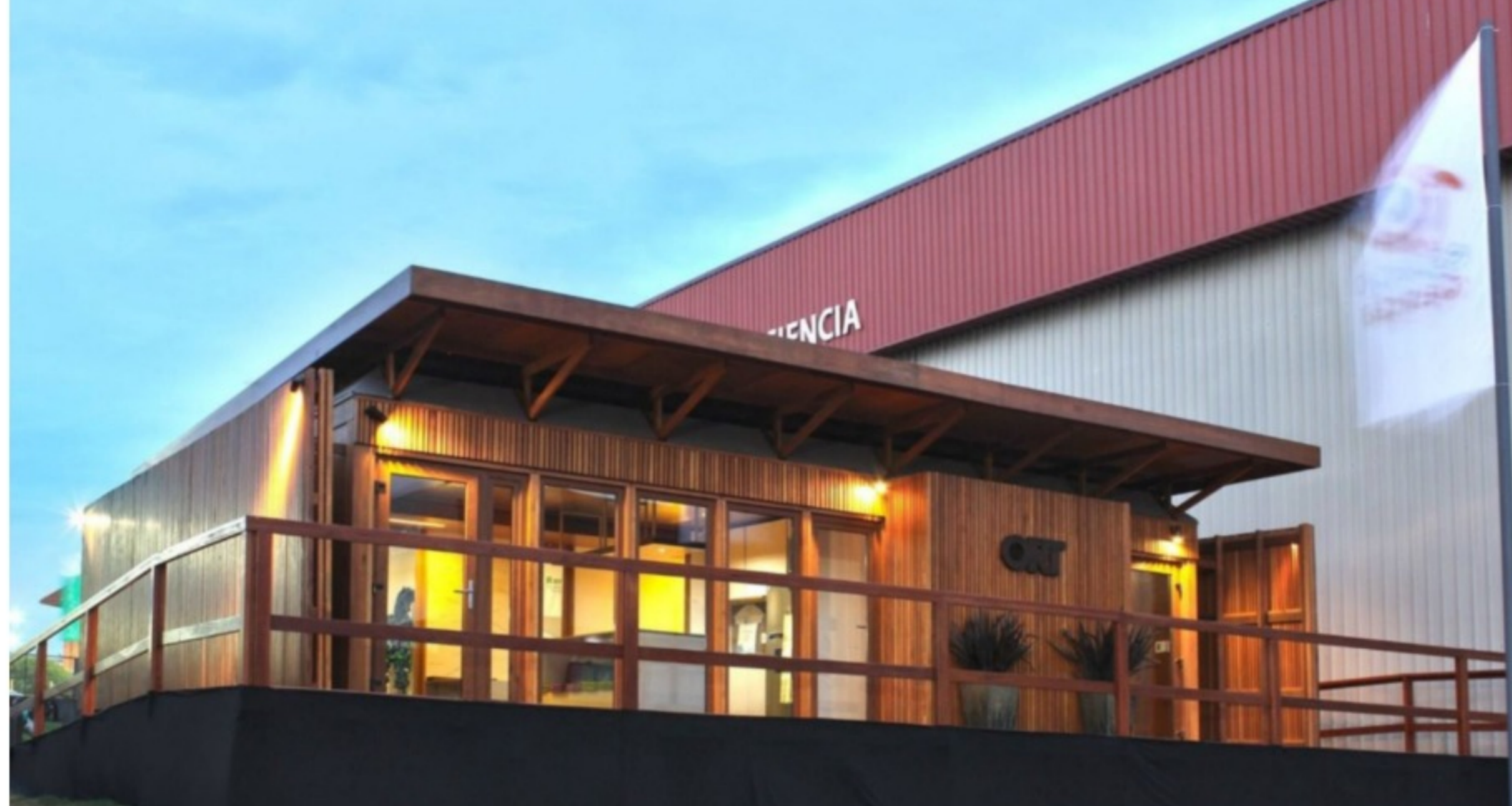
La Casa Uruguaya

El consumo de energía en el hogar está altamente influenciado por las condiciones naturales de ventilación, temperatura e iluminación. Actualmente, 38% de las emisiones totales de CO 2 provienen de edificios, de acuerdo con el Informe de Estado Global de 2018 de la ONU.