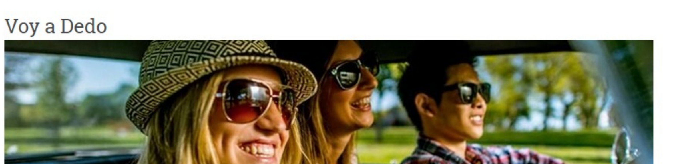
Voy a Dedo